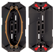
Virkesbredd 120 mm