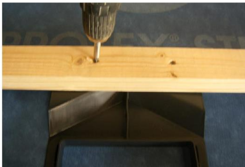
Der skrues 4 max 45 mm. lange skruer igennem lægten af undertagskraven ca. 15 mm. fra overkant af lægten. Ribbene på undersiden af undersiden af kraven sikrer, at der ikke kan komme kontakt mellem undertag og skruer.