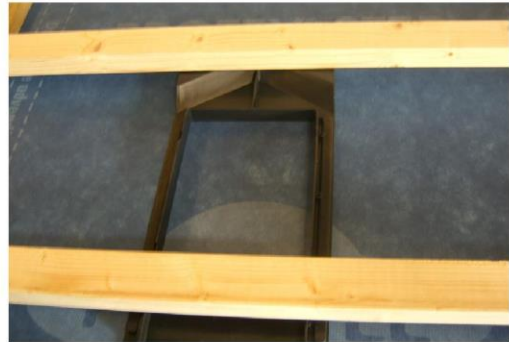
Det øverste element med pakningen på undersiden, monteret imellem underlægter og undertag.