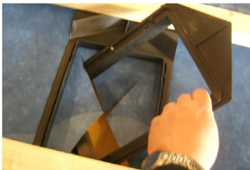
Det nederste element puttes ud gennem huller, klikkes fast og skrues i skruehullerne med de 4 medfølgende 35 mm skruer.