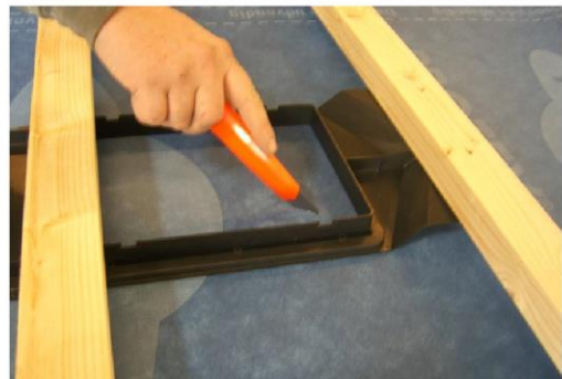
Der skæres et snit fra hjørne til hjørne.