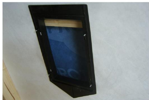
Undertagskraven færdigmonteret, set indefra.