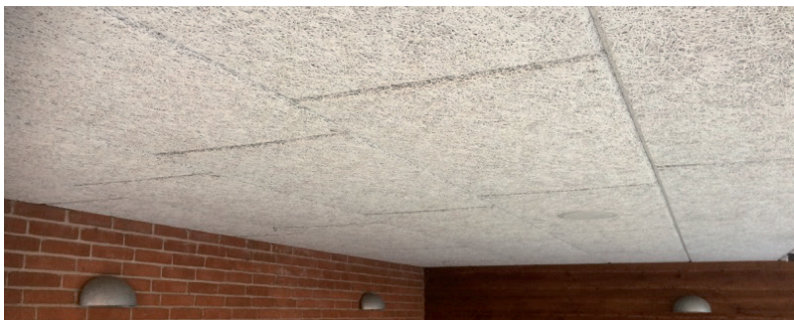
Fibro-ID Natur lys/fin K11