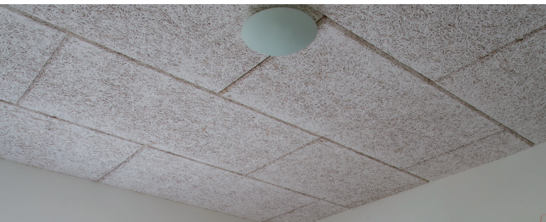
Fibro Kustik Light Hvid lys/superfin K11

Træbetonpladerne er produceret med en øget densitet langs pladekanter til gavn for kantstyrke og skruefasthed. Densitetsforøgelsen vil i varierende omfang være synlig som en naturlig del af beklædningens visuelle udtryk.